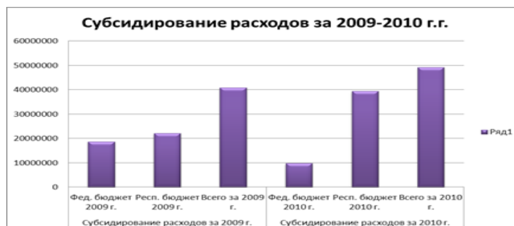
Рис.1.1 Соотношение субсидирования расходов за 2009-2010 гг.

Соотношение субсидирования расходов за 2009-2010 гг. представлено на рис 1.1